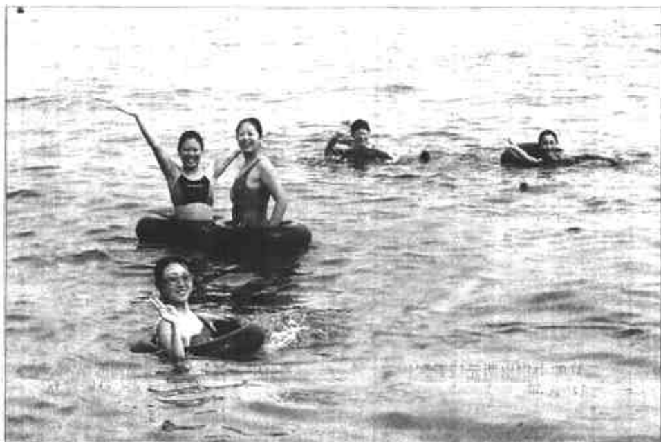
著名的避暑胜地秦皇岛北戴河日前又迎来了旅游黄金周期。在双休日里，许多北京、天津及东北的游人或与全家或亲朋一起来到北戴河度周末，体会大海的清凉。秦皇岛地理位置优越，京秦、京沈等高速公路通车后大大缩短了这几个城市与大海的距离，夏日里到大海游泳更成为不少人度周末的首选。图为来自北京的游人在海中畅游。(新华社记者 高洁 摄)

就是以粉煤灰替代水泥，以钢渣替代碎石和沙子，用于建设工程。经过长期的调查、试验，张建民的研究在今年4月获得成功，并在石家庄市中华大街道路改建工程中首次应用。6月11日，经上海通建工程建设监理咨询有限公司检验，工程各项指标均达到设计要求。 据介绍，把钢渣和粉煤灰用于建设工程，大大降低了建设成本。经测算，中华大街改建工程将用钢渣3.62万立方米、粉煤灰2.5万立方米，降低成本100万元以上。更重要的是解决了困扰人们多年的污染难题。有人预测，在不久的将来，堆积在石家庄市郊的一座座钢渣山、粉煤灰山，都将被建设工程——“吃掉”，还大地以翠绿，还空气以清新。 (新华社记者 魏春学 李新民)