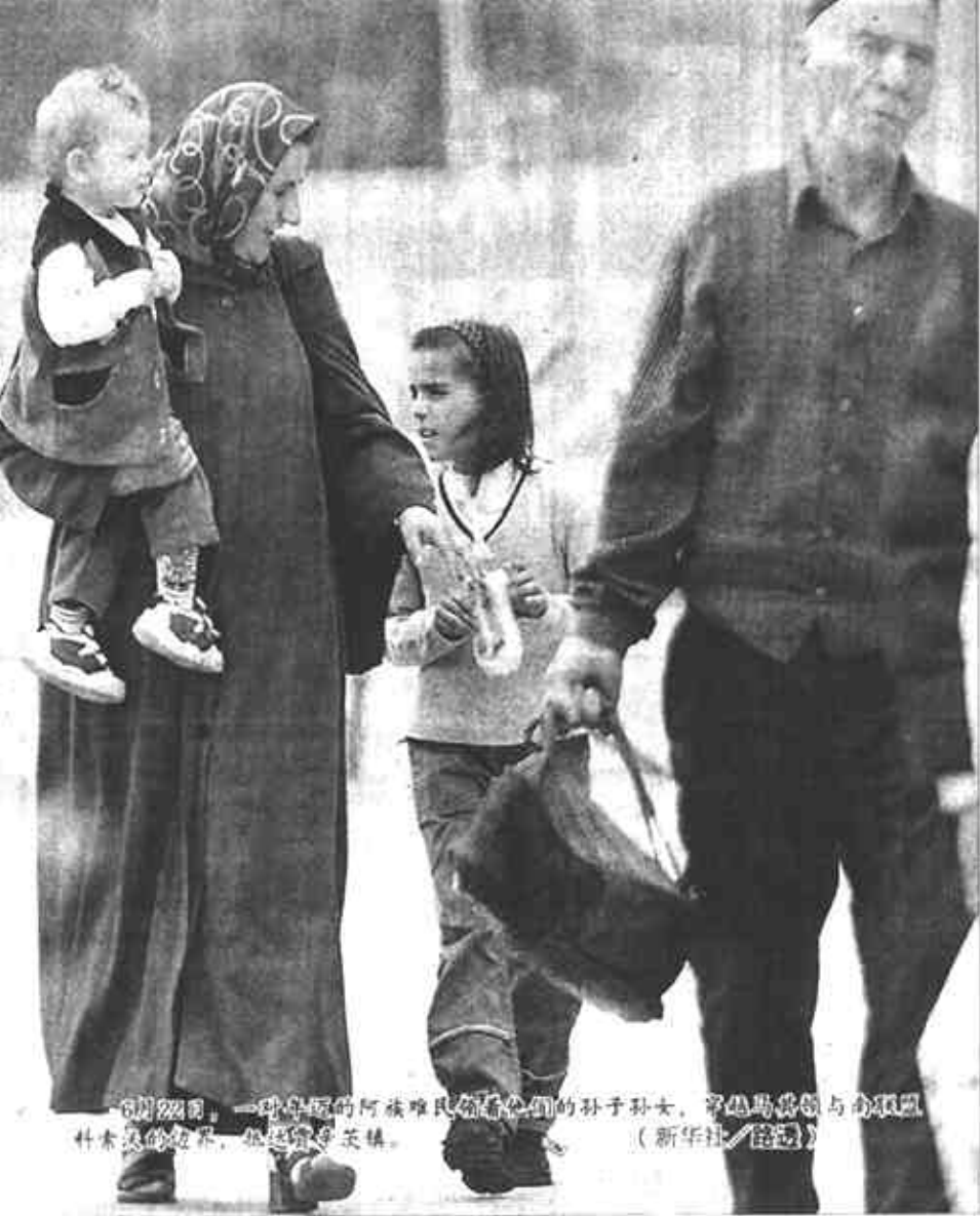
6月22日，一种新型的阿拉伯民族服饰的孩子们，在乌鲁木齐市人民广场游玩。

每年开学之际，学生在交学费的同时交纳一笔3元、5元不等的“平安保险费”，这件事许多中小学生的家长司空见惯的事，追究起来却是保险公司强收保险费的违法行为。 近日，内蒙古自治区工商管理部门对内蒙古东胜市一些学校强制收取学生保险费案件进行了专门调查处理。工商行政管理部门在调查中发现，中国人寿保险公司伊克昭盟分公司营业部通过78所学校、幼儿园代收“学生平安保险费”，自1999年以来共收取学生保险费396万多元。 学校和部分教师为什么愿意让保险公司挤收学费这趟“顺车”呢？而且甘愿为保险公司代收呢？原来保险公司给校方和部分教师一笔数额不小的“手续费”。工商管理部门在调查中发现，学校和教师收到了保险公司按保险费数额百分之三左右提取的手续费。中国人寿保险公司伊克昭盟分公司营业部共向78所学校、幼儿园付手续费近16万元。 接受调查的学生、家长普遍反映：保险费每年开学时随学费统一收取，收费前均未征得本人同意，收费亦不开具有关收据。 工商部门认为，调查证实，保险公司在收取学生保险费过程中采取了强制手段。违反了《反不正当竞争法》第六条和第八条有关规定，属于限制竞争和强制保险行为，应当予以查处。 内蒙古自治区工商局公平交易局局长陈林说，本来，让学生花钱买个平安，是件好事，但应出于学生和学生家长自愿，平安保险费实在不应该搭学费的车。近年来，保险公司以高额手续费委托学校、幼儿园强卖学生保险的现象并不鲜见，今后，工商管理部门将陆续查处。 (新华社记者 刘军 殷耀)