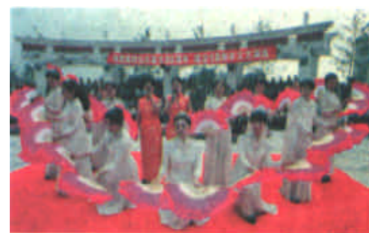
6月23日，北京城建职工在他们新建的北苑家园居民小区绿地花园与居民联欢，以丰富多彩的文艺节目歌颂中国共产党的丰功伟绩，共庆建党80周年。图为城建集团职工在表演自编节目《颂歌献给共产党》。